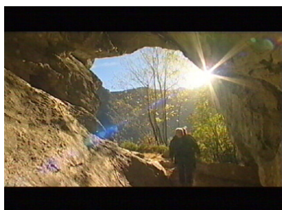
Die Gralshöhle von Videssos

Seiner Hinterlassenschaft entstammt die sogenannte „Maquette“, ein seltsames Landschaftsmodell, auf dem unter anderem das Grab von Josef von Arimathäa eingezeichnet ist. Lässt sich damit die letzte Ruhestätte des Gralshüters lokalisieren und: Schließt sich hier der Kreis der Gralslegende?