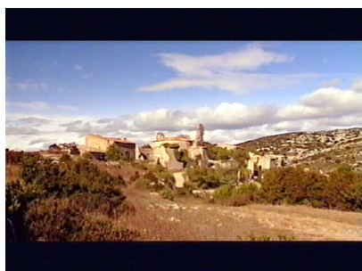
Das Dorf Perillos - Die „wahre“ Gralsburg?